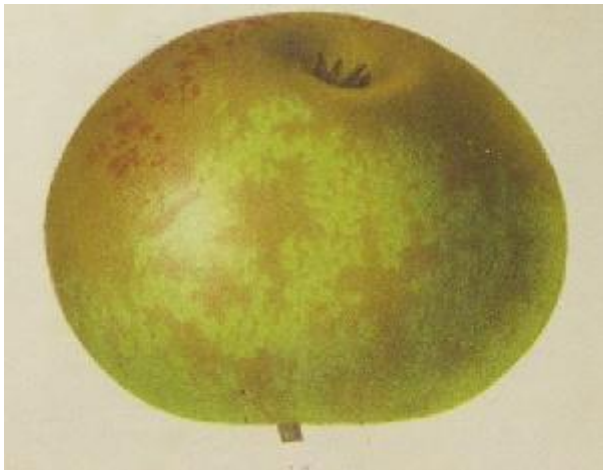
Vue A.Mas Le Verger 1868.

MATURITE-CONSOMMATION : Octobre-décembre-janvier. Type 2 moins conique que celle décrite par Oberdieck. De plus chez cet auteur les loges sont lisses.